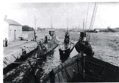
Ubåter ved kai foran Ladestasjonen.

I 1940 var «A2», «A3» og «A4» stasjonert ved Teie Ubåtstasjon. Tidlig om morgenen 9. april gikk fartøyene ut Kanalen i Tønsberg til angitte felt. «A2» kom i trefning med tyske krigsskip og ble skadet. Den drev